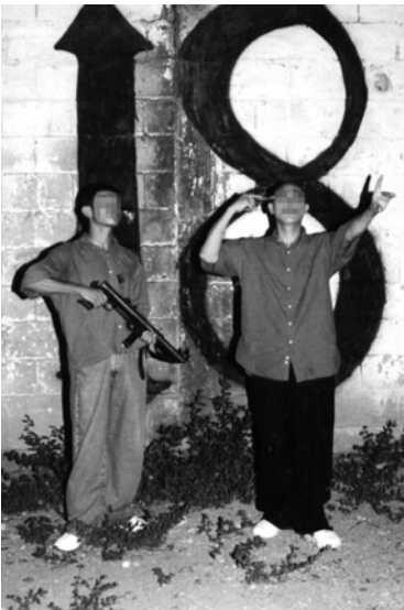
Fotografia 1.1 - 'Pandilleros' armados, Honduras / Jha-Ja 2004.

Não há dúvida de que há lugar para mais estudos nessa área, talvez mais teóricos ou acadêmicos em seus objetivos e discursos. Aceitando suas limitações, este estudo visa ser um ponto de partida para a comparação dos grupos armados organizados e das crianças e dos jovens que os constituem. Essas comparações podem, enfim, necessitar ir mais longe se programas inovadores para o tratamento desse problema forem criados e implementados com sucesso.